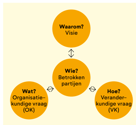
De Witte, M. & Jonker, J. (2020). De kunst van veranderen . Amsterdam: Boom

voor het Vierballenmodel van Marco de Witte en Jan Jonker (2020). Het gaat erom de vier vragen Waarom , Wat , Hoe en Wie in samenhang te beantwoorden. Het model helpt ons om bij elk van onze opgaven systematisch en reflectief te handelen. Dat wil zeggen: het waarom, de bedoeling, niet uit het oog te verliezen en gaandeweg verder te laden, en vervolgens bewust de route van verandering te kiezen. En die kan per opgave verschillen. Bij sommige opgaven weten we waarom we iets doen én wat we gaan doen, dan werken we vanuit een plan. Bij andere opgaven weten we wel waarom we iets willen, maar nog niet hoe we er moeten komen, dan werken we ontwikkelingsgericht.